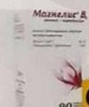
ТАБЛ. П. О. 1000 МГ, №30 ЛП-003961