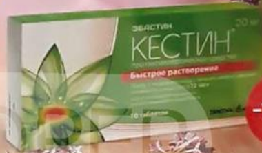
ТАБЛ. ЛИОФИЛИЗОВАННЫЕ 20 МГ, №10 лп-000769