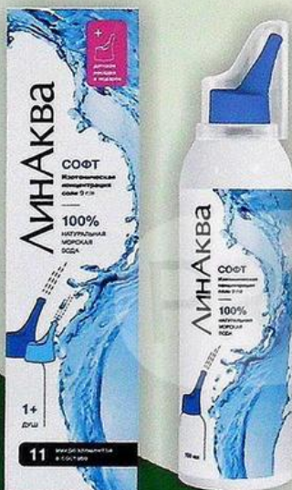
Линаква Софт аэрозоль д/промывания носа 150мл