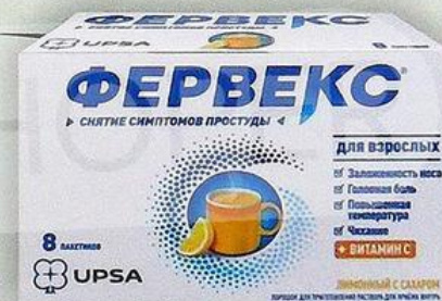
Фервекс пор. пак. Лимон №8