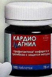
Кардиомагнил таб. п/п/о 75мг+15.2мг №100