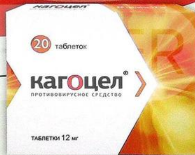
Кагоцел таб. 12мг №20