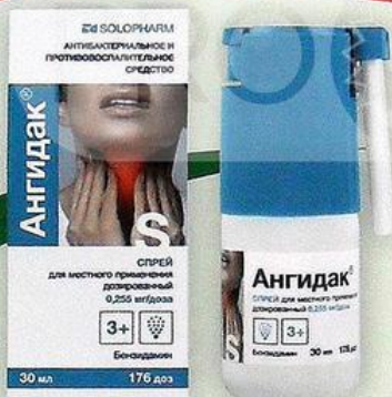
Ангидак спрей д/местн.прим. 0.255 мг/доза 30мл