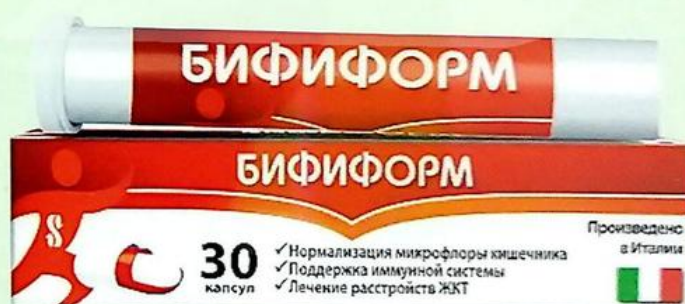
Бифиформ капс. №30