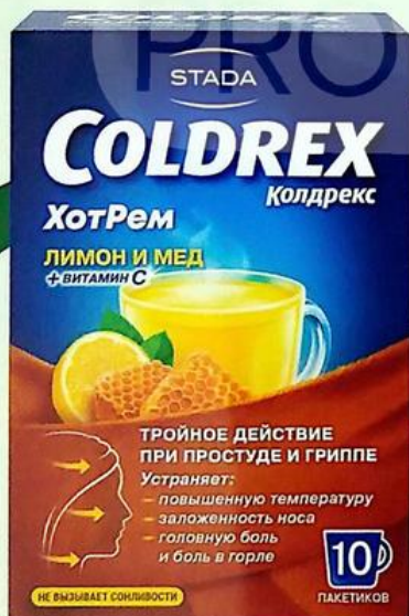
Колдрекс Хотрем пор. пак. Лимон/Мед №10