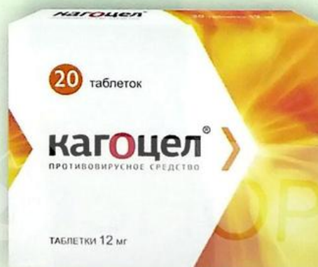
Кагоцел таб. 12 мг №20